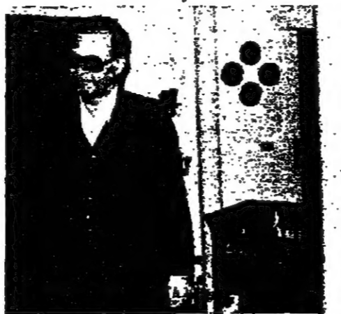
الرئيس الحصن يستقبل المفيد هشام تريم ( تصوير - جيبب شيا )

الرئيس الحصن في منزله أمس يدايب هرتة ( تصوير - جيبب شيا )